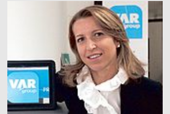
PAOLA CASTELLACCI Vicepresidente Confindustria

L'UNIONE EUROPEA ha imposto, nell'aprile scorso, nuove regole sui materiali da costruzione che interessano imprese e committenti, soprattutto pubblici. Per spiegare tutte le novità previste dal nuovo regolamento europeo, la Sezione Empolese - Valdelsa di Confindustria Firenze, ha organizzato un seminario in programma oggi alle 14, presso l'Auditorium della Cassa di Risparmio di Firenze in via Pievano Rolando, 2 a Empoli, proprio sotto gli uffici di Confindustria.