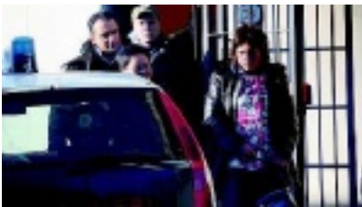
CONVINTA La donna col marito

IL CASO CLAMOROSA PROTESTA DI UNA LAVORANTE CINESE