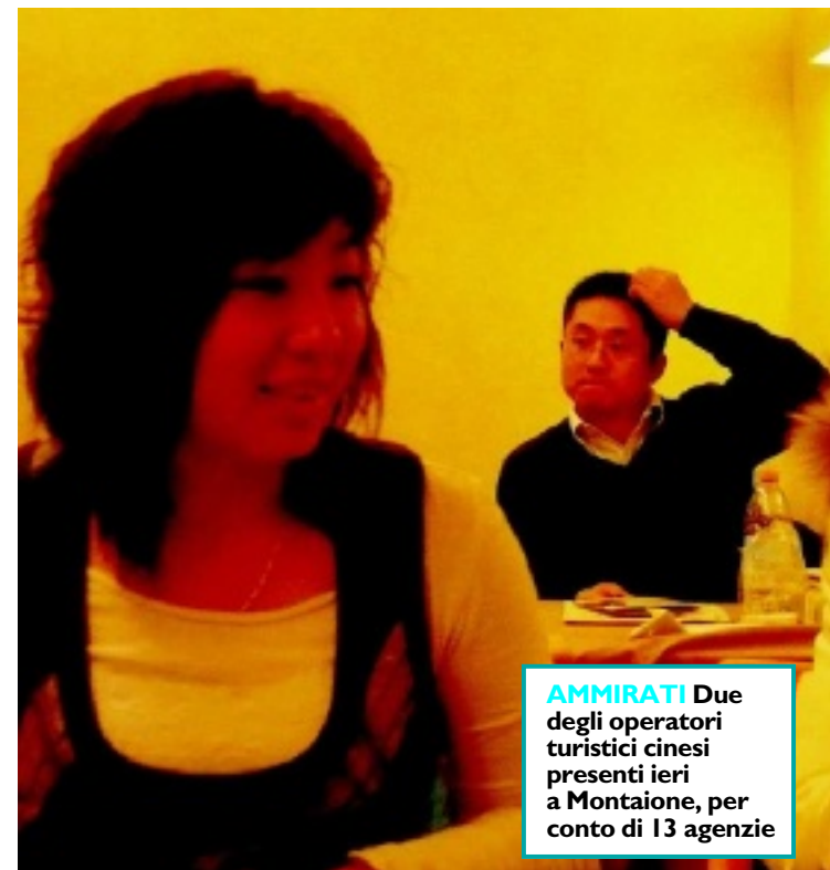
AMMIRATI Due degli operatori turistici cinesi presenti ieri a Montaione, per conto di 13 agenzie

I turisti da noi, si sa, vanno presi per la gola. E quelli che vengono dalla grande Cina non fanno certo eccezione.