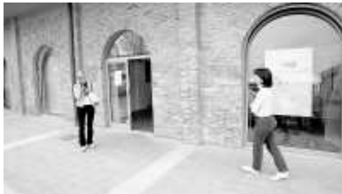
La sede dell'Agenzia per lo sviluppo in via delle Fiascaie a Empoli

Dal giardiniere al fornaio: al via i corsi per diventare un artigiano