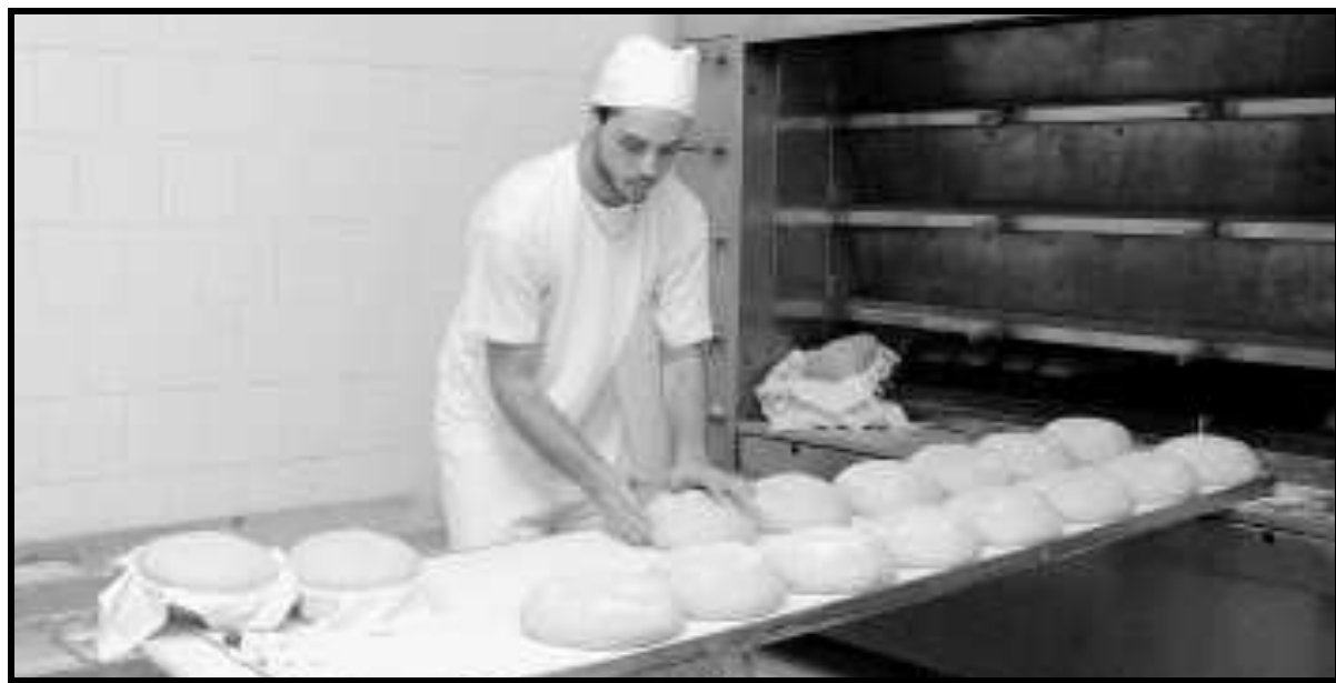
Uno dei corsi organizzati dall'Asev formerà addetti panificatori, fornai e pasticceri

Quindi il via ai corsi (in quattro casi sono previste due edizioni), che hanno una ricetta simile (le modalità di iscrizioni e di svolgimento sono ripilogati nell'articolo a fianco):