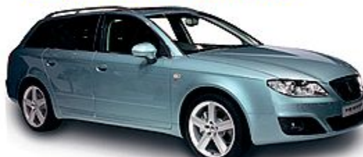
SEAT EXEO EXEO ST 2.0 TDI 170 CV SPORT

Listino da € 32.730 Ns. prezzo da € 22.730*