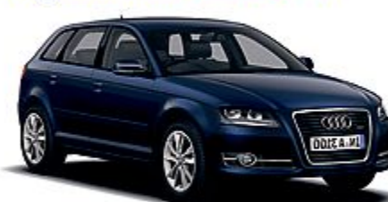
AUDI A3 A3 1.6 TDI SPORTBACK AMBITION

Listino da € 30.670 Ns. prezzo da € 21.670*