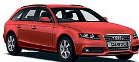
AUDI A4 2.0 TDI AVANT ADVANCED FAP

Listino da € 41.325 Ns. prezzo da € 28.325*