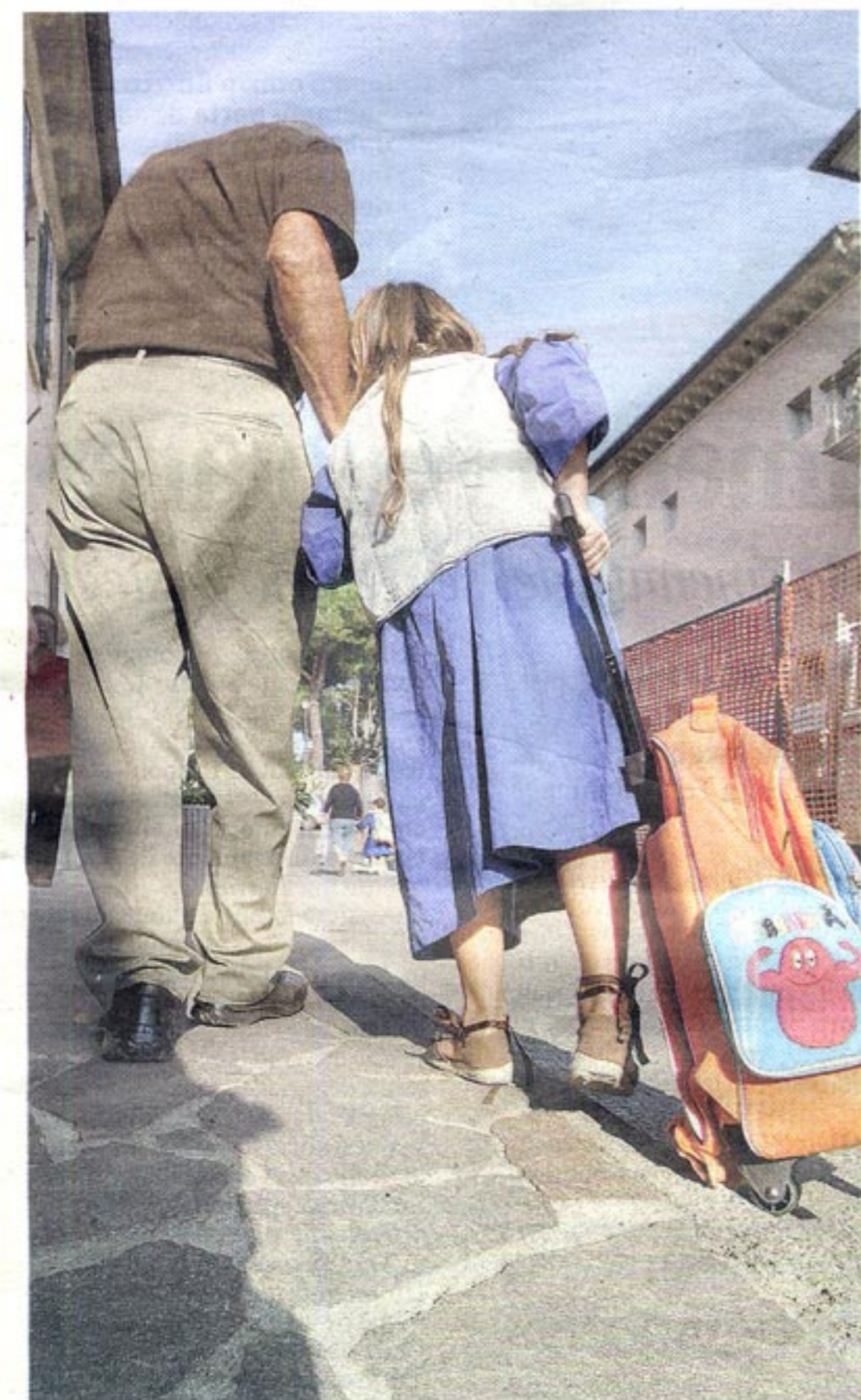
DIFFICOLTA' Sempre più famiglie vivono sotto la soglia di povertà