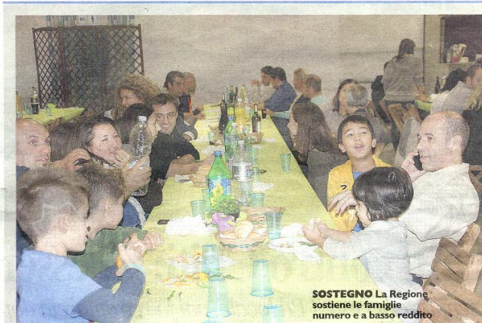
SOSTEGNO La Regione sostiene le famiglie numerose e a basso reddito

OPPORTUNITA' APERTO IL BANDO PER ACCEDERE AI CONTRIBUTI