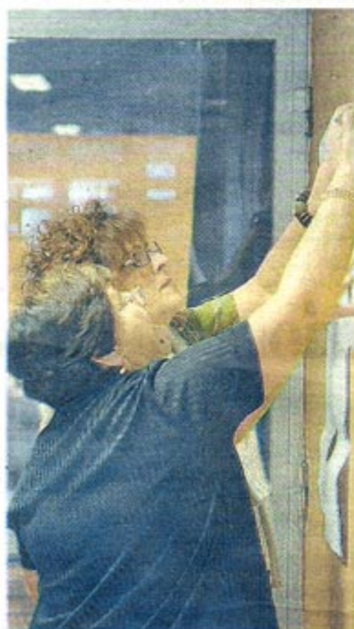
FORMAZIONE Corsi di lingue all'Asev per avere più possibilità

CERCASI istituti e aziende che vogliano collaborare al progetto Lime. L'appello arriva dall'Asev. Scopo del progetto europeo, che ha come paesi partner Italia, Germania, Regno Unito, Spagna e Polonia, è aiutare i migranti a sviluppare competenze linguistiche e culturali con l'ausilio di strumenti interattivi. Tra i prossimi obiettivi, lo sviluppo della piattaforma virtuale: la sperimentazione coinvolgerà almeno 10 insegnanti e 30 studenti in ogni paese. Info: 0571 76650.